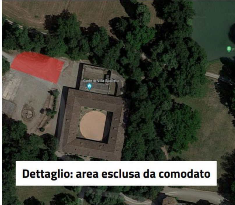
Dettaglio: area esclusa da comodato