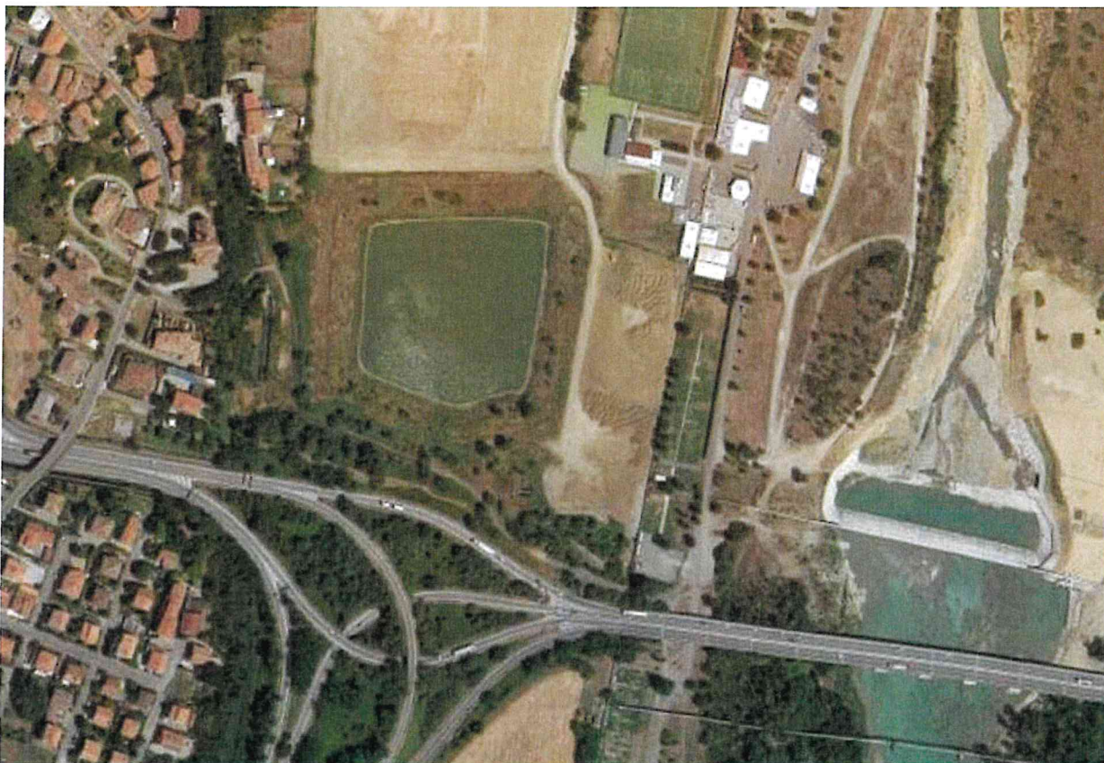
Inquadramento da ortoimmagine del bacino di Villalunga

Al fine di una migliore identificazione dell'invaso esistente di cui sopra si riportano alcune fotografie dello stato di fatto e dell'ubicazione dell'invaso stesso: