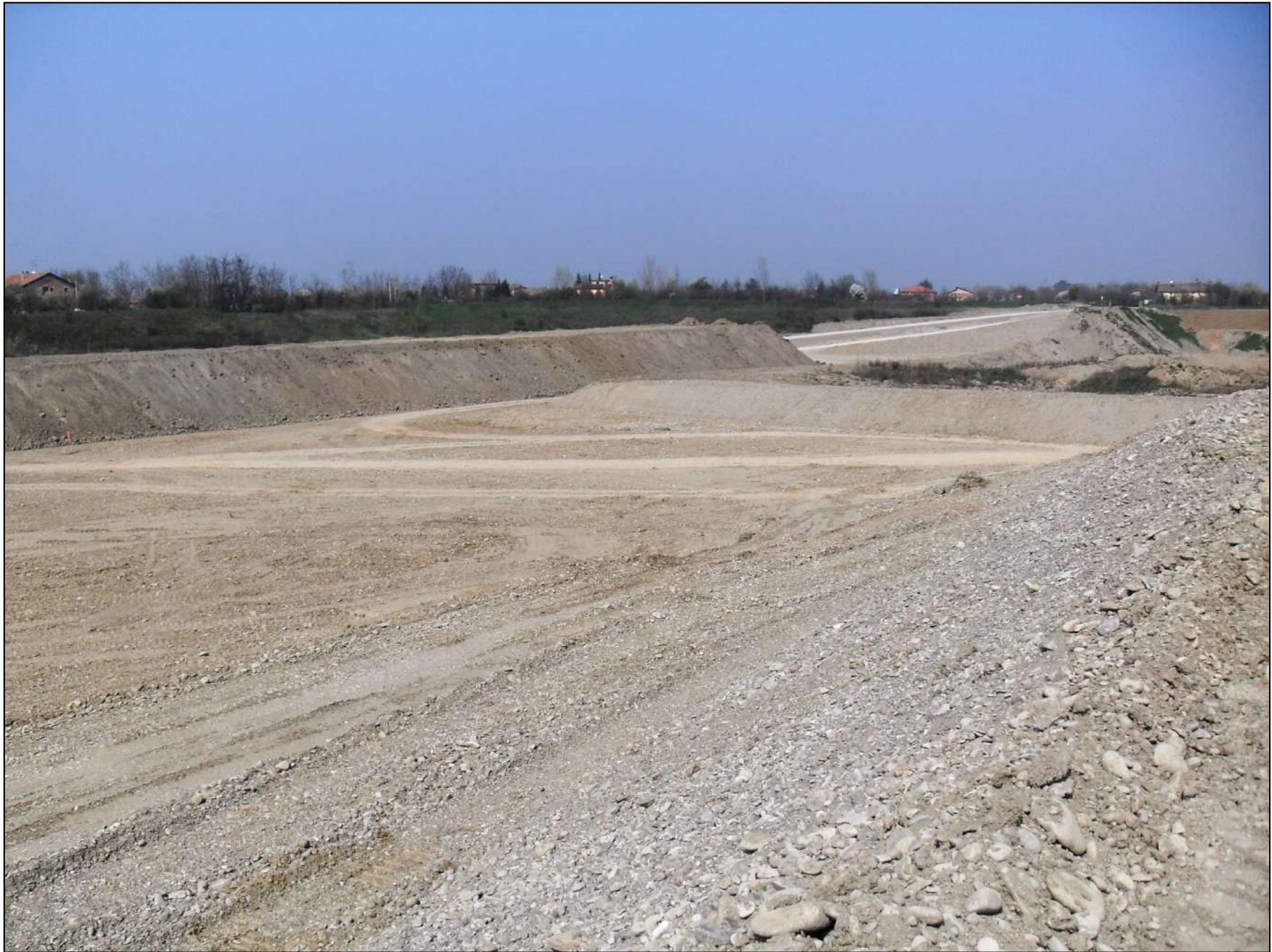
- FOTO 16: Panoramica, vista da Sud/Est verso Nord/Ovest, dello stato di fatto in Cava “Valentini” nella zona centrale e meridionale.