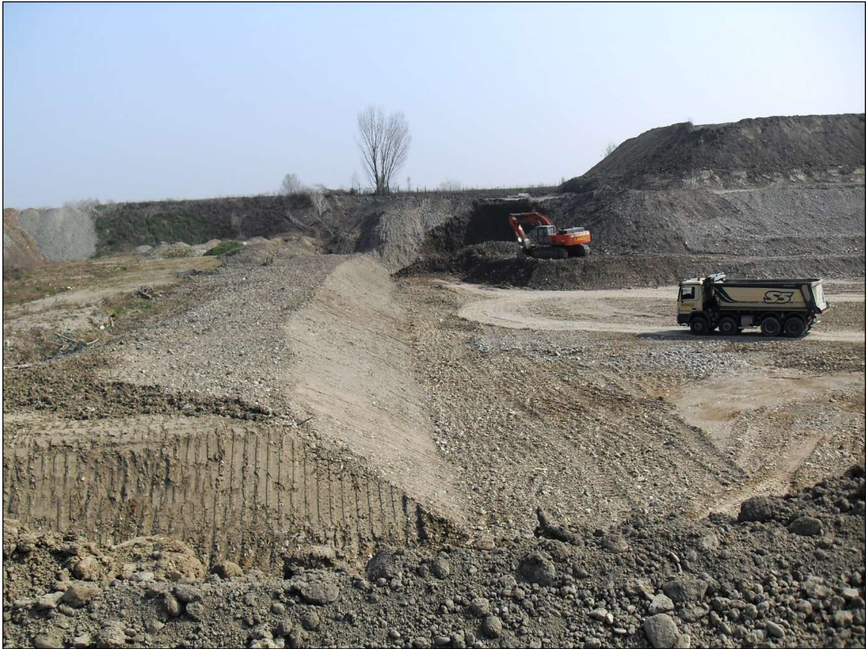
- FOTO 20: Altra panoramica, vista da Ovest verso Est, dei lavori di escavazione attualmente in corso in Cava “Valentini”, fino alla quota di -10 m dal p.c. originario, a ridosso del confine sud di Cava “San Lorenzo”.