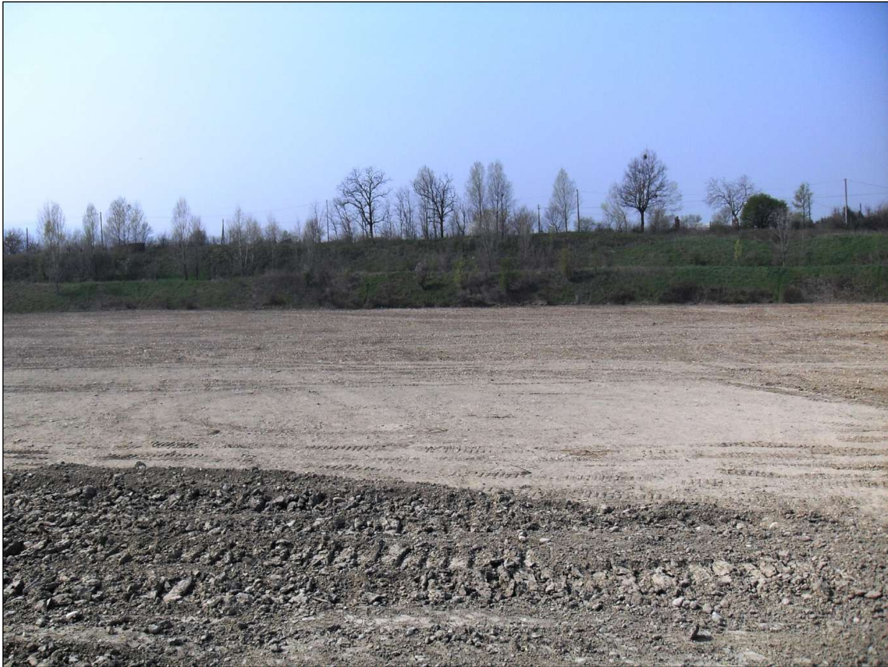
- FOTO 5: Panoramica, vista da Est verso Ovest, dello stato di fatto dell'attuale fondo scavo a -10 m dal p.c. originario nella zona meridionale dell'area di Cava "Valentini". Nella parte alta della foto sono chiaramente visibili le due parti di scarpata che fiancheggiano rispettivamente Via Bassa, sul lato ovest, ed il viottolo che porta alla Casa Mazzacani, sul lato sud.