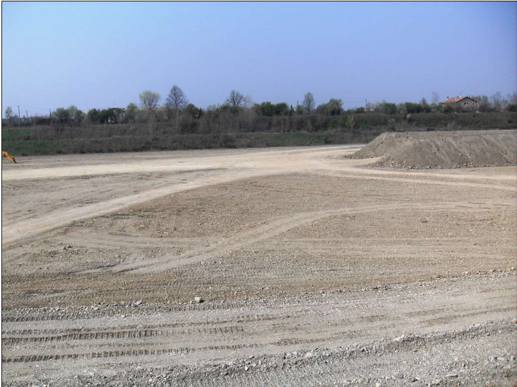
- FOTO 7: Altra panoramica, vista da Est verso Ovest, del vasto fondo scavo, alla quota di -10 m dal p.c. originario, attualmente presente nella zona centrale dell'area di Cava "Valentini".