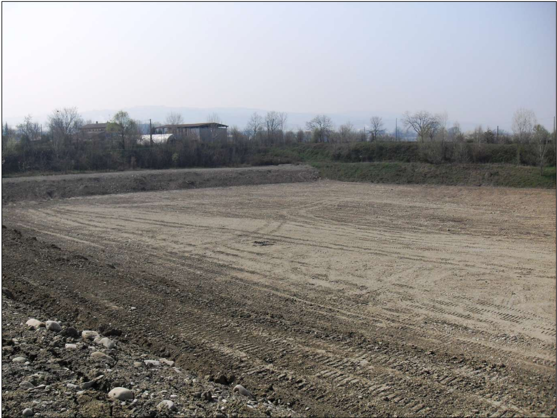
- FOTO 14: Panoramica, vista da Nord/Est verso Sud/Ovest, dell'attuale fondo scavo a -10 m dal p.c. originario nella parte più meridionale dell'area estrattiva di Cava "Valentini".