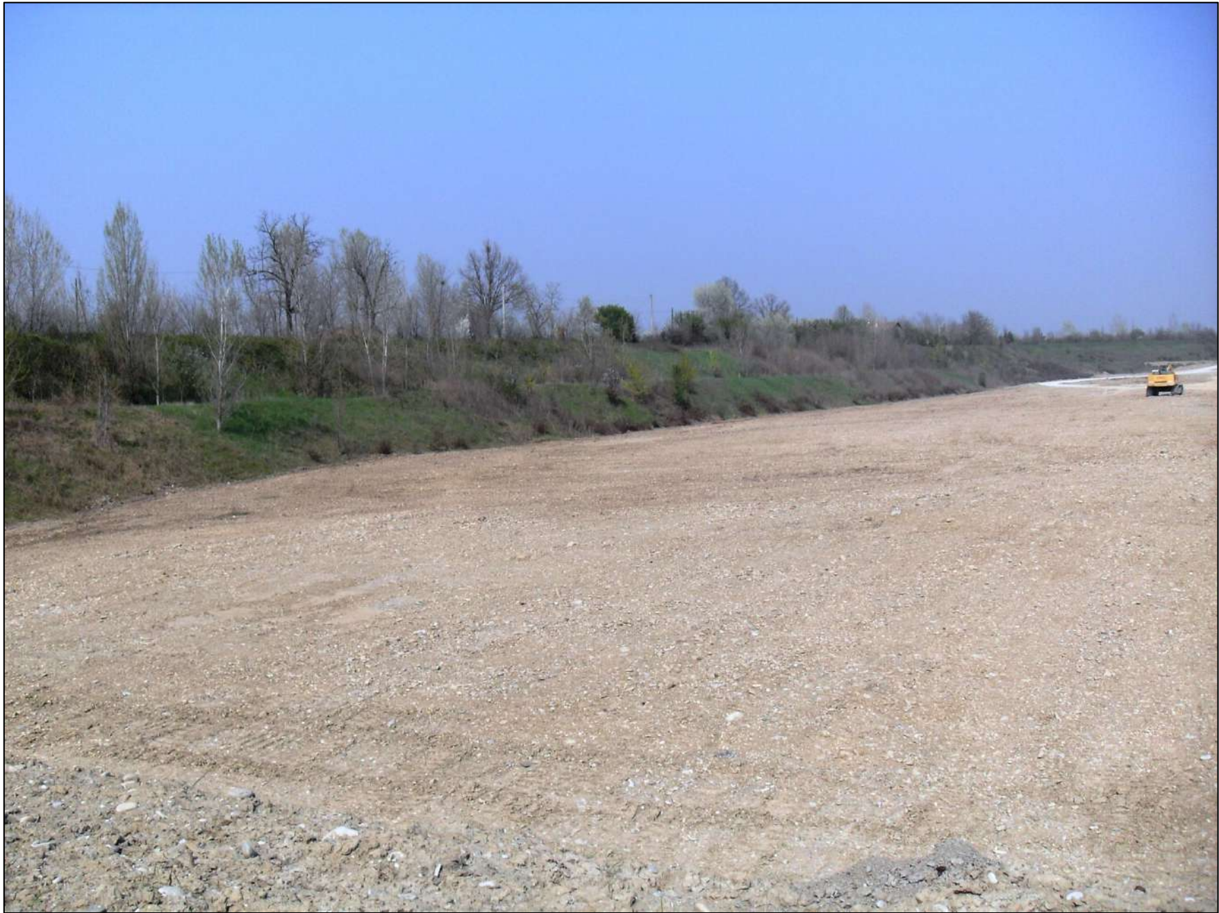
- FOTO 3: Panoramica, vista da Sud/Est verso Nord/Ovest, dello stato di fatto in Cava “Valentini” nella parte più settentrionale dell’area a ridosso della scarpata che fiancheggia la strada comunale Via Bassa.