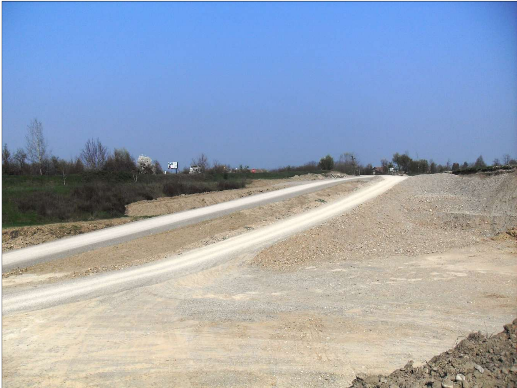
- FOTO 2: Primo piano delle due rampe che, a partire dall'accesso di Cava "Valentini" sulla S.P.51, portano all'attuale fondo scavo posto alla quota di -10 m dal p.c. originario. La rampa alla sinistra della foto, costruita di recente in terra, è stata realizzata per poter scavare il materiale ghiaioso che dà corpo alla rampa sulla destra, in attesa dell'approvazione del nuovo Progetto di Coltivazione a -20 m dal p.c..