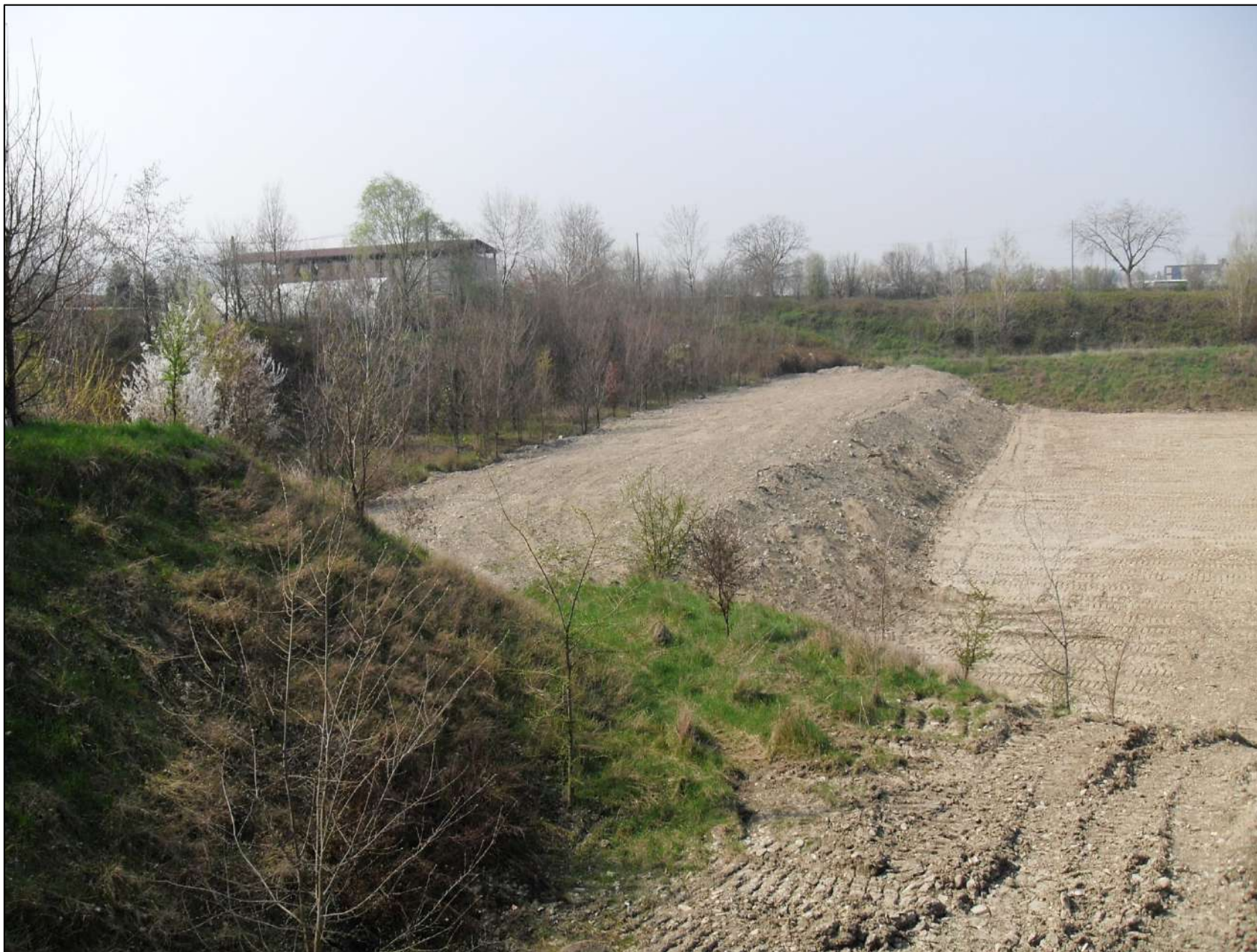
- FOTO 15: Panoramica, vista da Est verso Ovest, dell'estremità sud dell'area di Cava "Valentini" in prossimità dello stradello Mazzacani. Nella foto, a ridosso della scarpata, è visibile una parte del materiale terroso rimosso dal grande cumulo di terra posto sull'area ancora vergine nella zona di cava più ad est al fine di poterne estrarre ghiaia fino alla quota di -10 m dal p.c., in attesa dell'approvazione del nuovo Progetto di Coltivazione a -20 m.