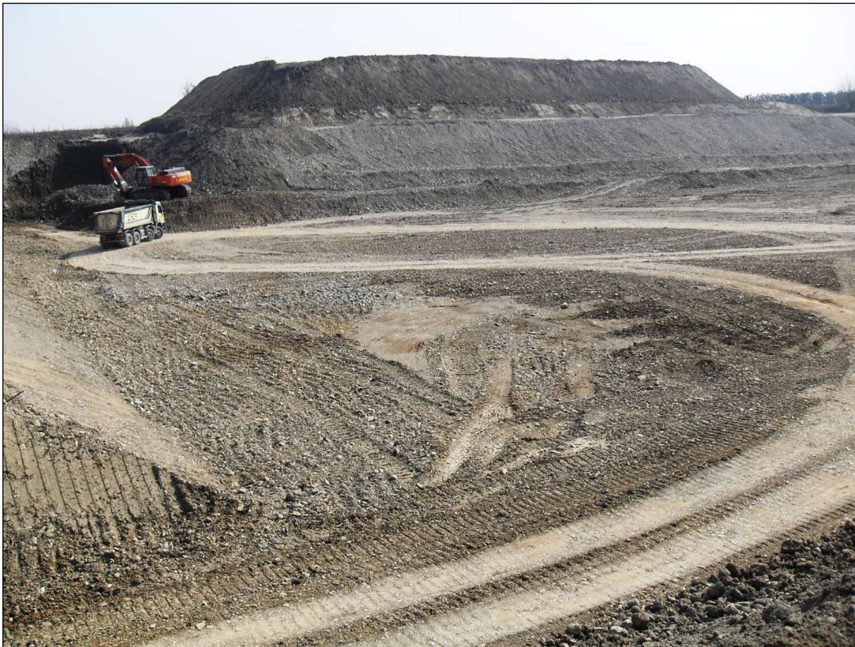
- FOTO 19: Panoramica, vista da Ovest verso Est, dello stato di fatto e dei lavori di coltivazione in corso in Cava “Valentini”, a ridosso del confine sud di Cava “San Lorenzo”, fino alla quota di -10 m dal p.c. originario.