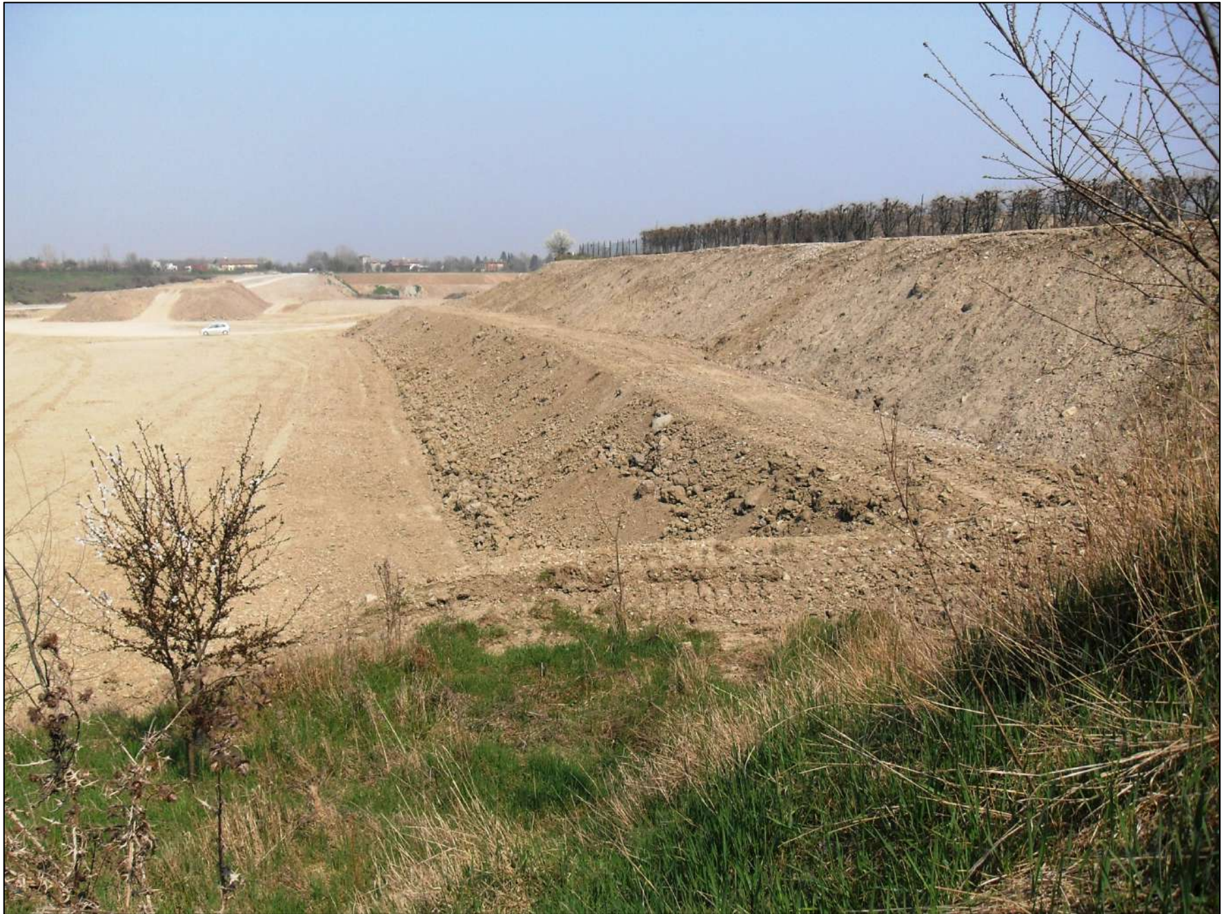
- FOTO 13: Altra panoramica, vista da Sud verso Nord, dello stato di fatto di Cava “Valentini” a ridosso della proprietà Mazzacani.