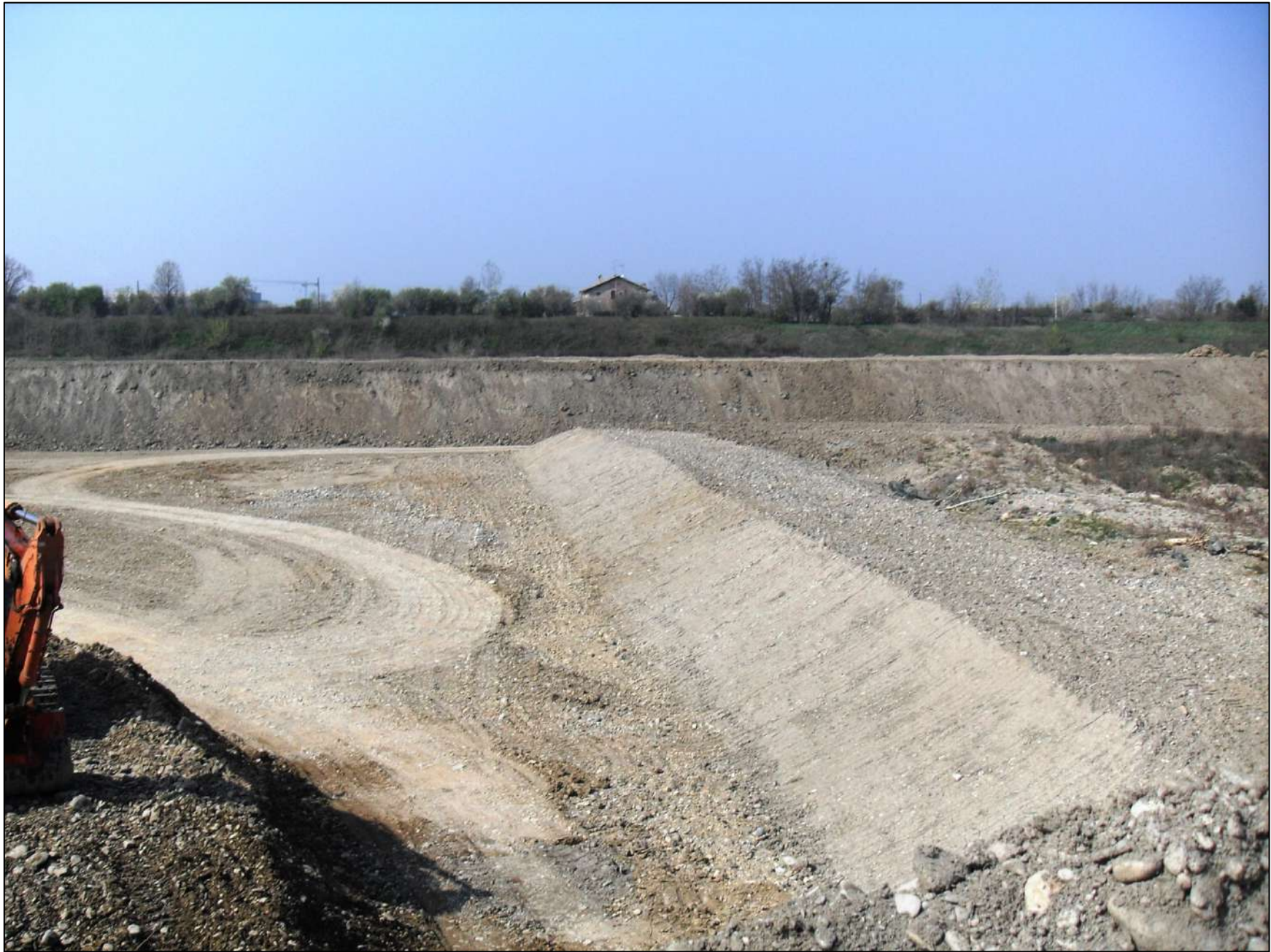
- FOTO 18: Panoramica, vista da Est verso Ovest, dello stato di fatto di Cava “Valentini” a ridosso del confine sud di Cava “San Lorenzo” dell’Emiliana Conglomerati S.p.A.. Come è possibile rilevare, lungo il confine con Cava “San Lorenzo” viene rimosso l’intero diaframma di separazione tra le due cave per poter abbassare la rete di recinzione.