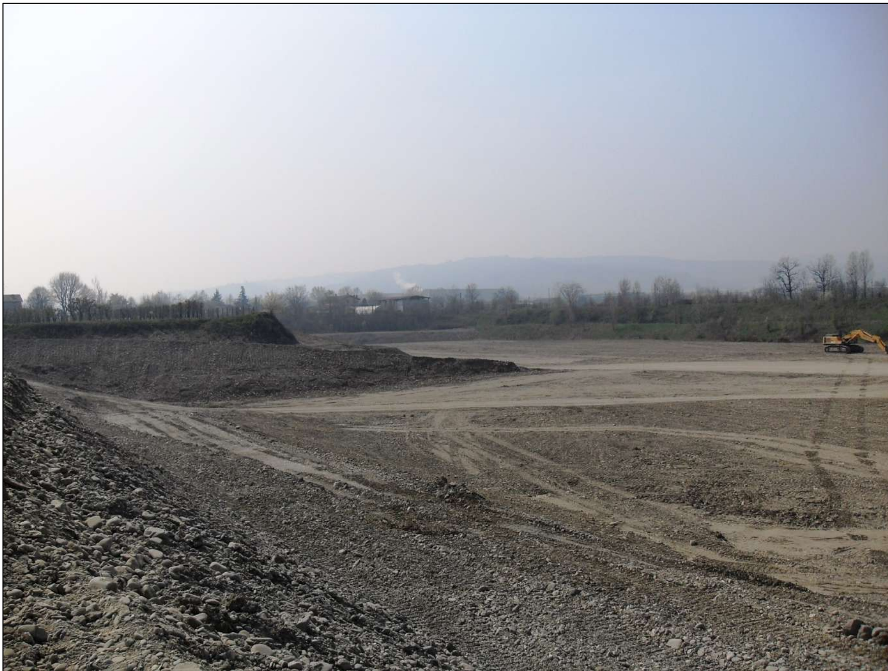
- FOTO 8: Panoramica, vista da Nord/Est verso Sud/Ovest, del fondo scavo alla quota di -10 m dal p.c. originario attualmente presente nella zona centrale e meridionale di Cava “Valentini”.