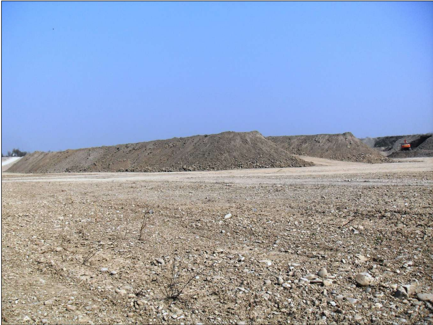
- FOTO 6: Panoramica, vista da Sud/Ovest verso Nord/Est, dello stato di fatto dell'attuale fondo scavo a -10 m dal p.c. nella zona centrale di Cava "Valentini". Il cumulo di terra visibile nella foto è parte del materiale terroso rimosso dal più grande cumulo presente sulla parte di area ancora allo stato vergine, nella zona di cava più ad est, al fine di poterne scavare la ghiaia sottostante.