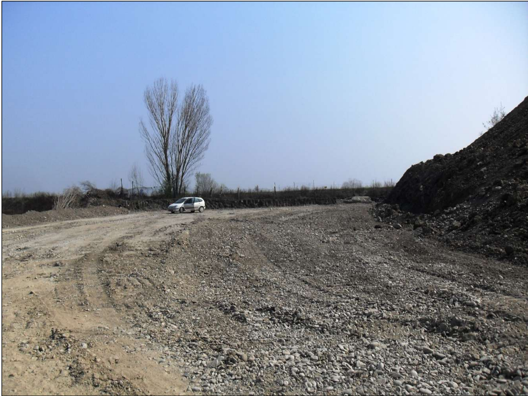
- FOTO 17: Panoramica, vista da Ovest verso Est, di parte della zona ancora allo stato vergine, a ridosso del confine sud di Cava “San Lorenzo” dell’Emiliana Conglomerati S.p.A., liberata dal grosso cumulo di terra per poter scavare la ghiaia sottostante in attesa dell’approvazione del nuovo Progetto di Coltivazione a -20 m dal p.c. originario.