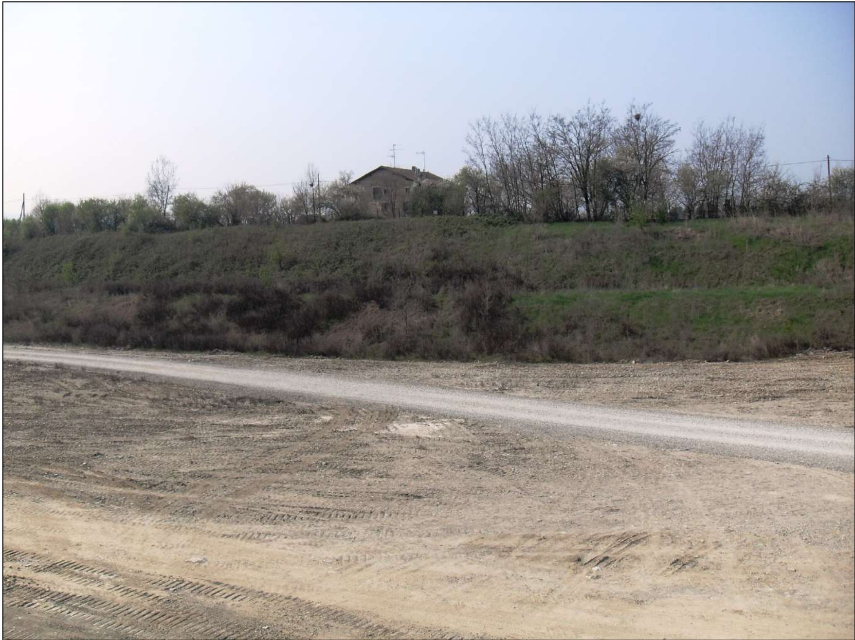
- FOTO 4: Panoramica, vista da Est verso Ovest, dello stato di fatto di Cava “Valentini” nella parte centrale dell’area a ridosso della scarpata che fiancheggia la strada comunale Via Bassa. In bella evidenza la vegetazione arborea ed arbustiva messa a dimora nella fascia di rispetto alla strada, larga 10 m come da deroga a suo tempo concessa dalla Provincia di Reggio Emilia.