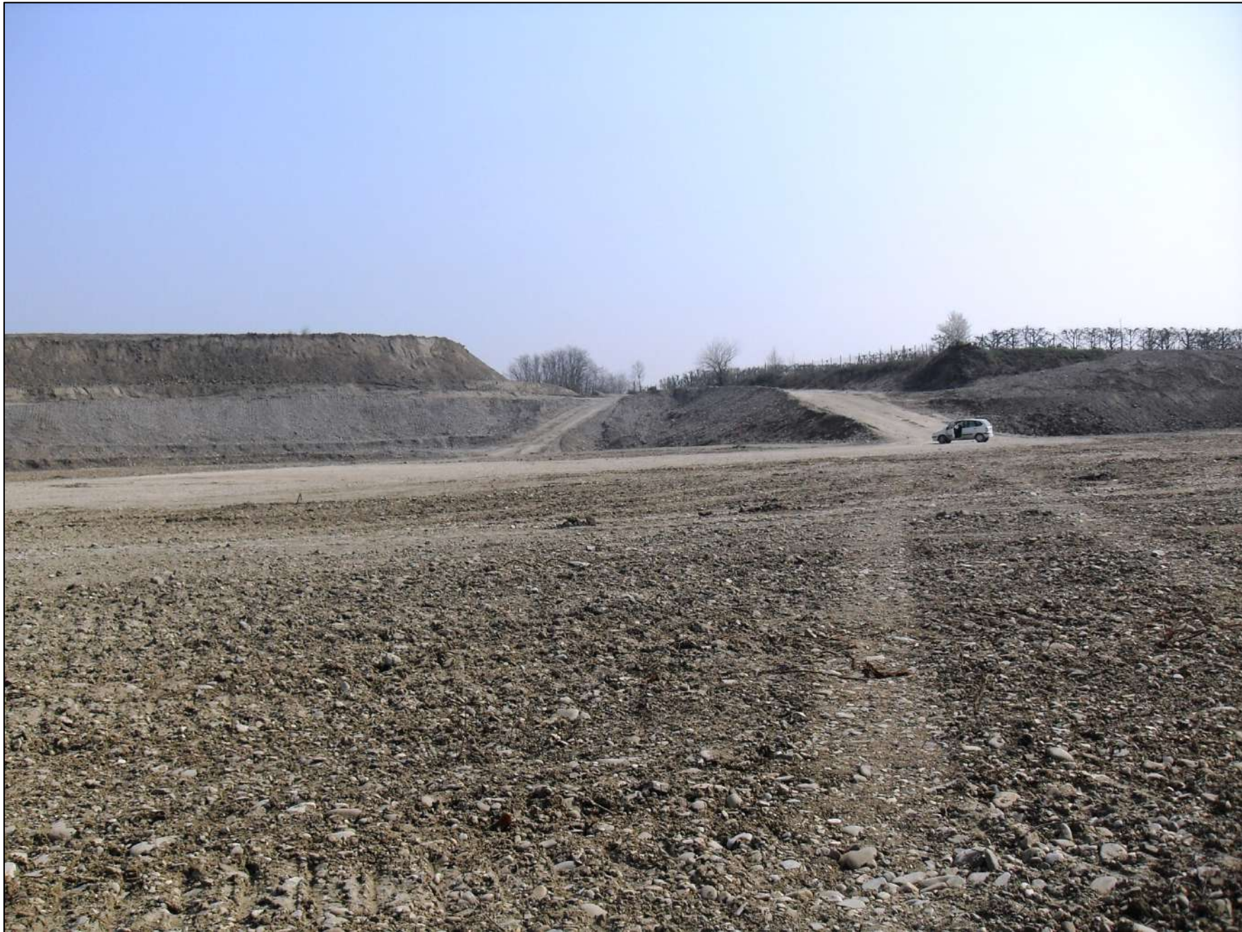
- FOTO 9: Bella panoramica, vista da Ovest verso Est, dello stato di fatto di Cava “Valentini” nella zona centrale di questa unità produttiva. In alto, a sinistra della foto, in bella evidenza la parte ancora vergine dell’area di cava con sopra il grosso cumulo di terra; sulla destra, la rampa per il trasporto al “Cantiere Brugnola” del materiale ghiaioso estratto dalla cava.