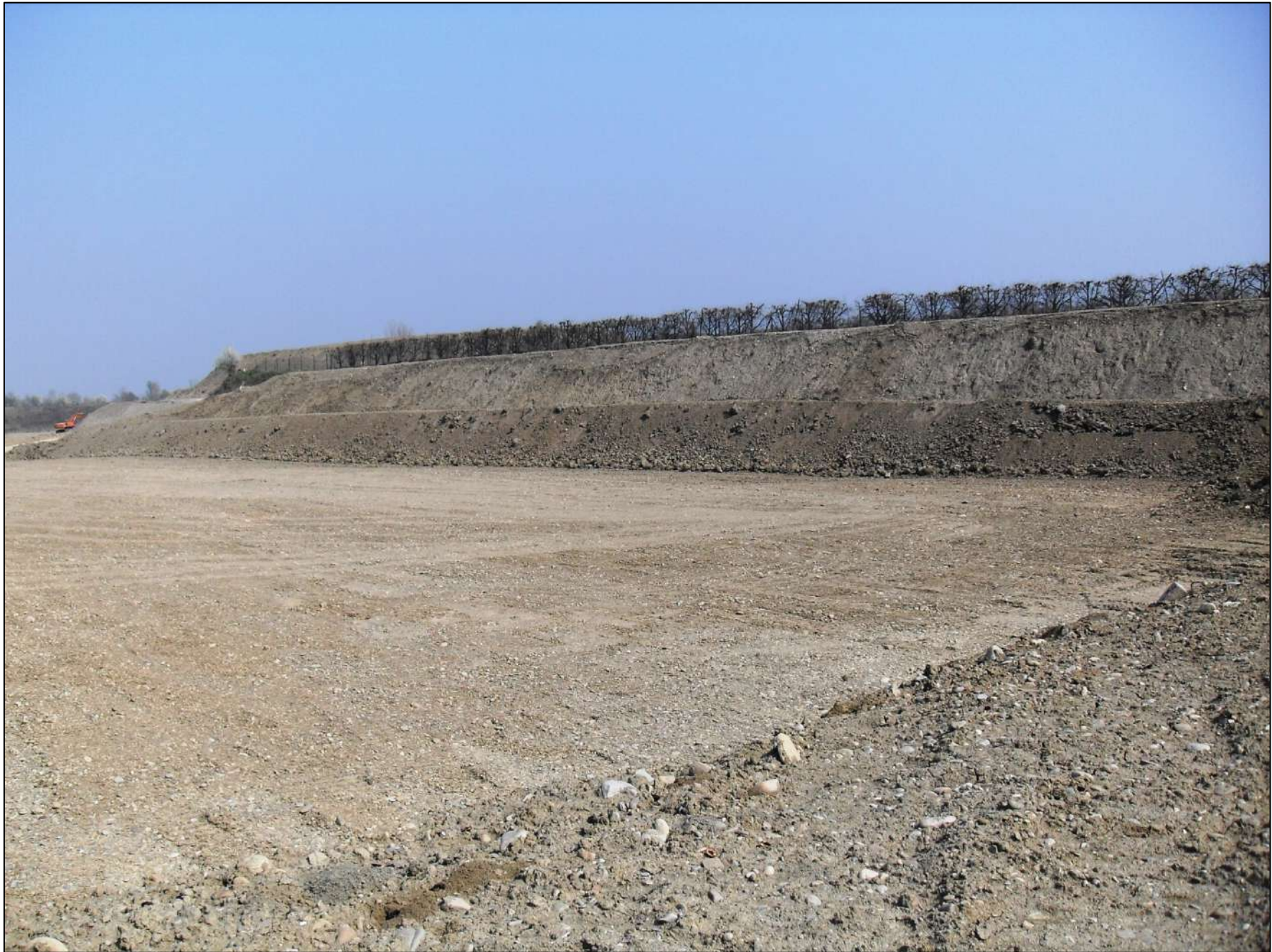
- FOTO 12: Panoramica, vista da Sud/Ovest verso Nord/Est, dello stato di fatto di Cava “Valentini” nella zona più meridionale a ridosso della proprietà Mazzacani.