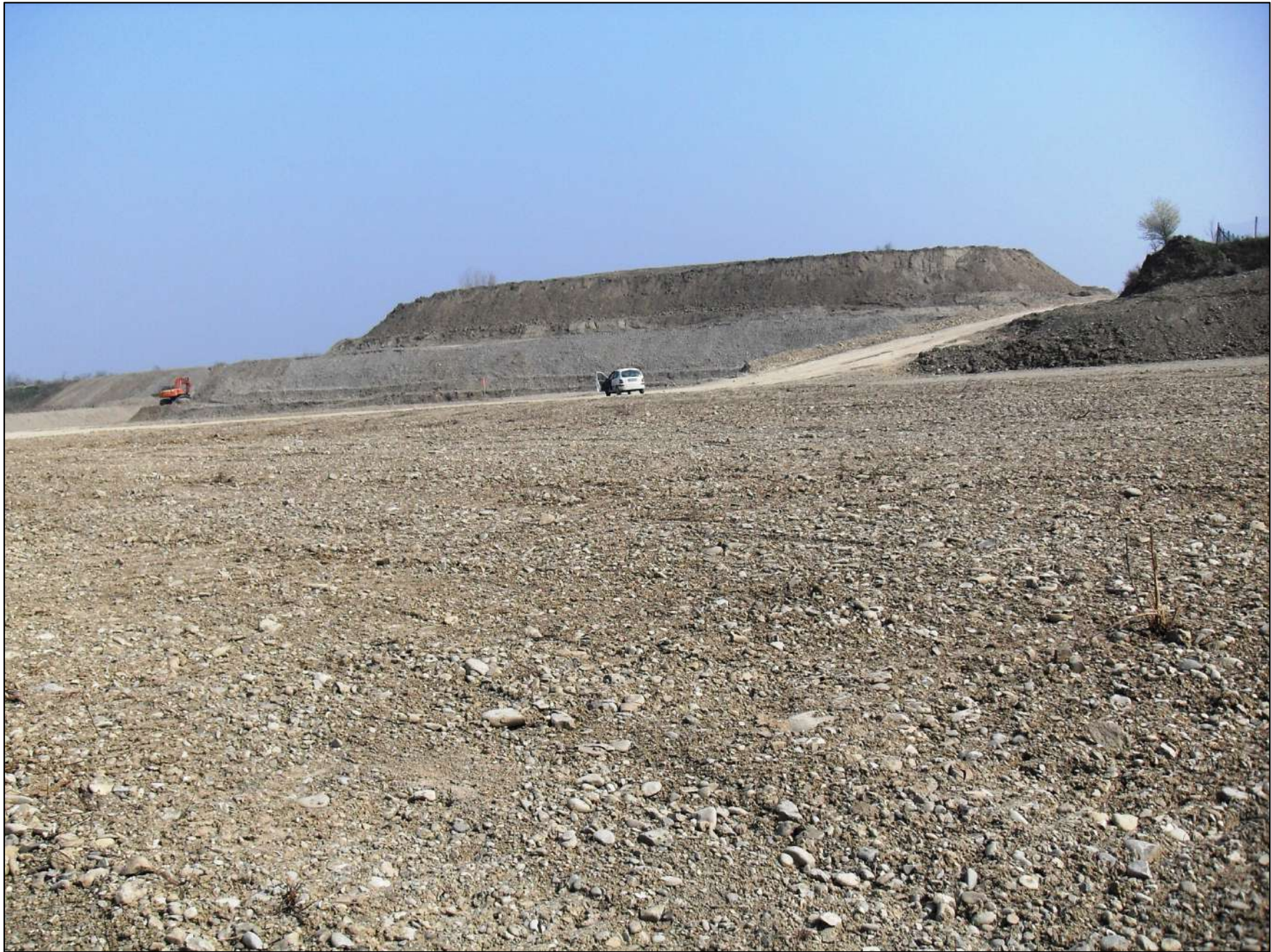
- FOTO 10: Altra panoramica, vista da Sud/Ovest verso Nord/Est, dello stato di fatto nella zona centrale di Cava “Valentini”.