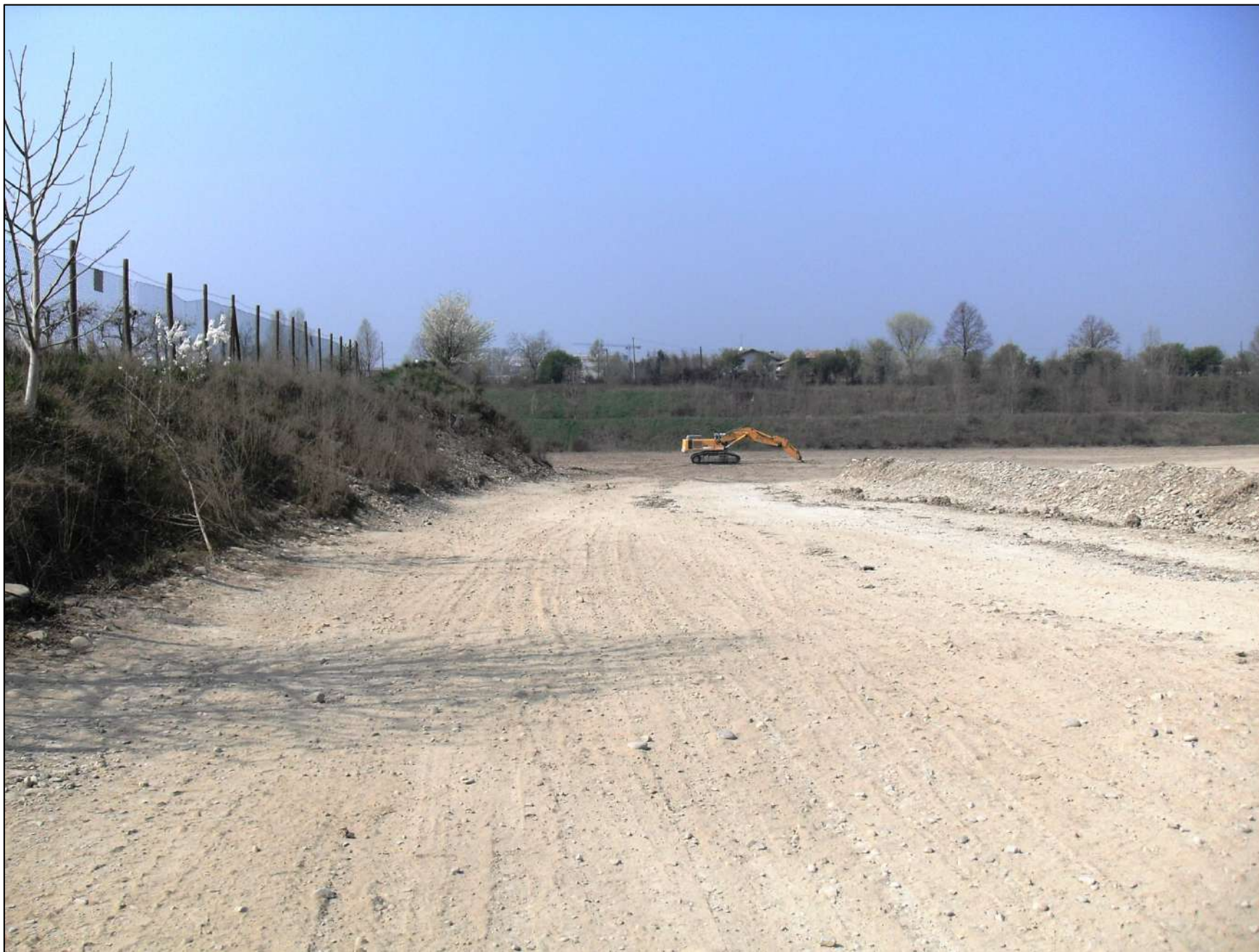
- FOTO 11: Panoramica, vista da Est verso Ovest, della rampa a ridosso del confine con la proprietà Mazzacani utilizzata per il trasporto al “Cantiere Brugnola” del materiale utile estratto da Cava “Valentini”.