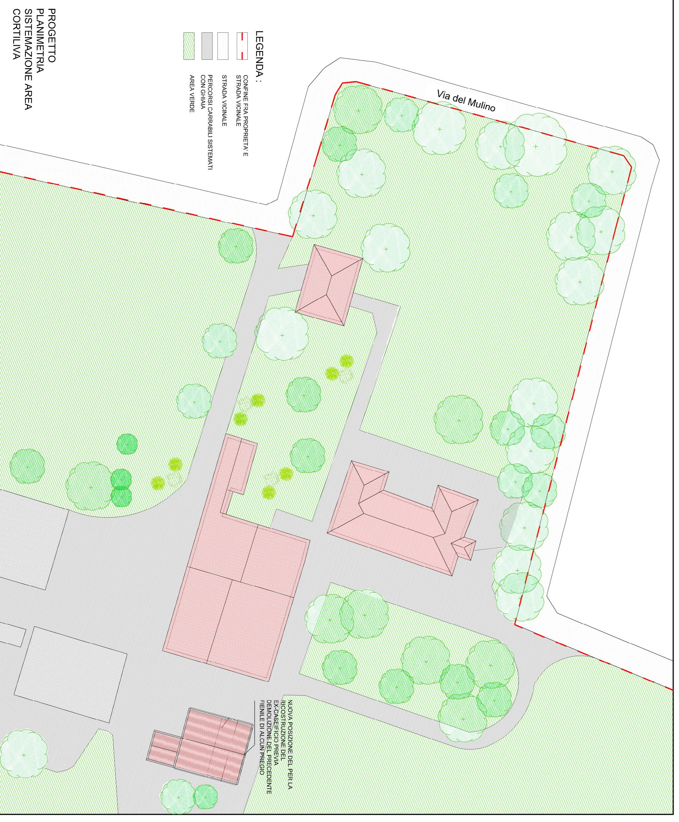
PROGETTO PLANIMETRIA SISTEMAZIONE AREA CORTILIVA