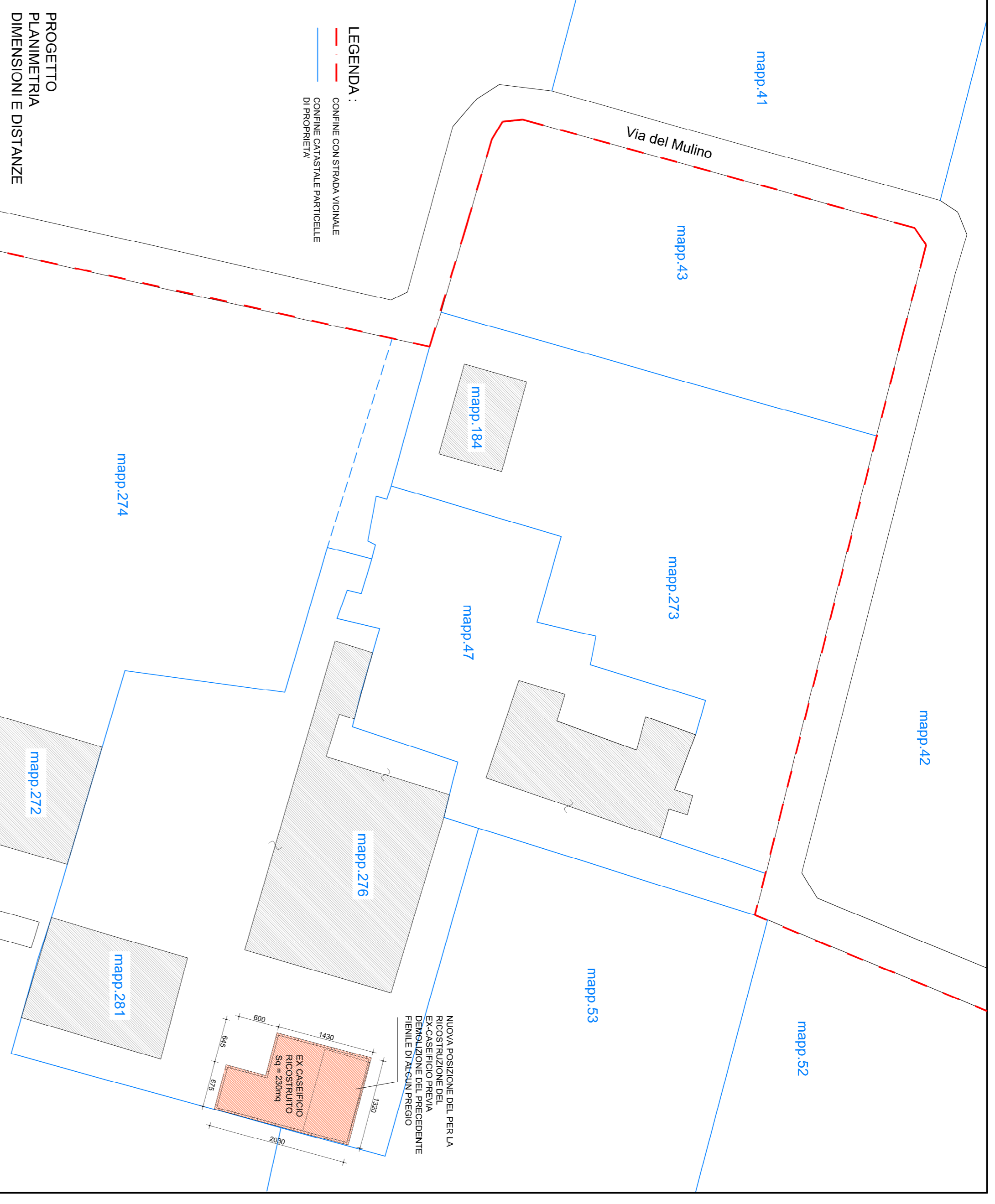
PROGETTO PLANIMETRIA DIMENSIONI E DISTANZE