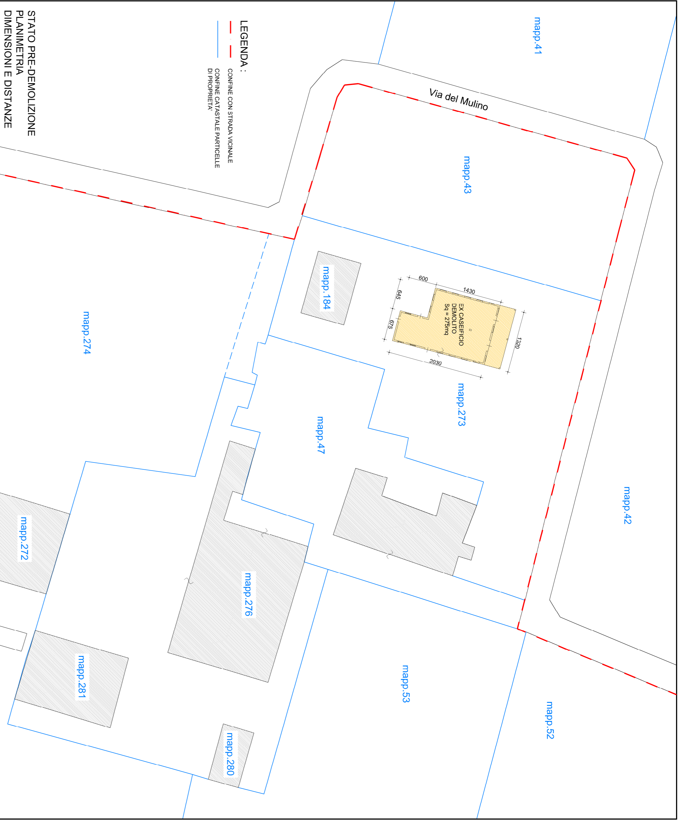
STATO PRE-DEMOLIZIONE PLANIMETRIA DIMENSIONI E DISTANZE