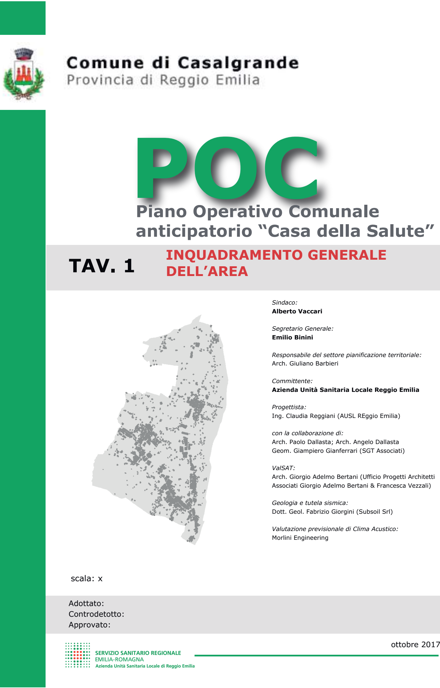
Estratto Carta Tecnica Regionale, Elemento n.219011 - Casalgrande Edizione 2016