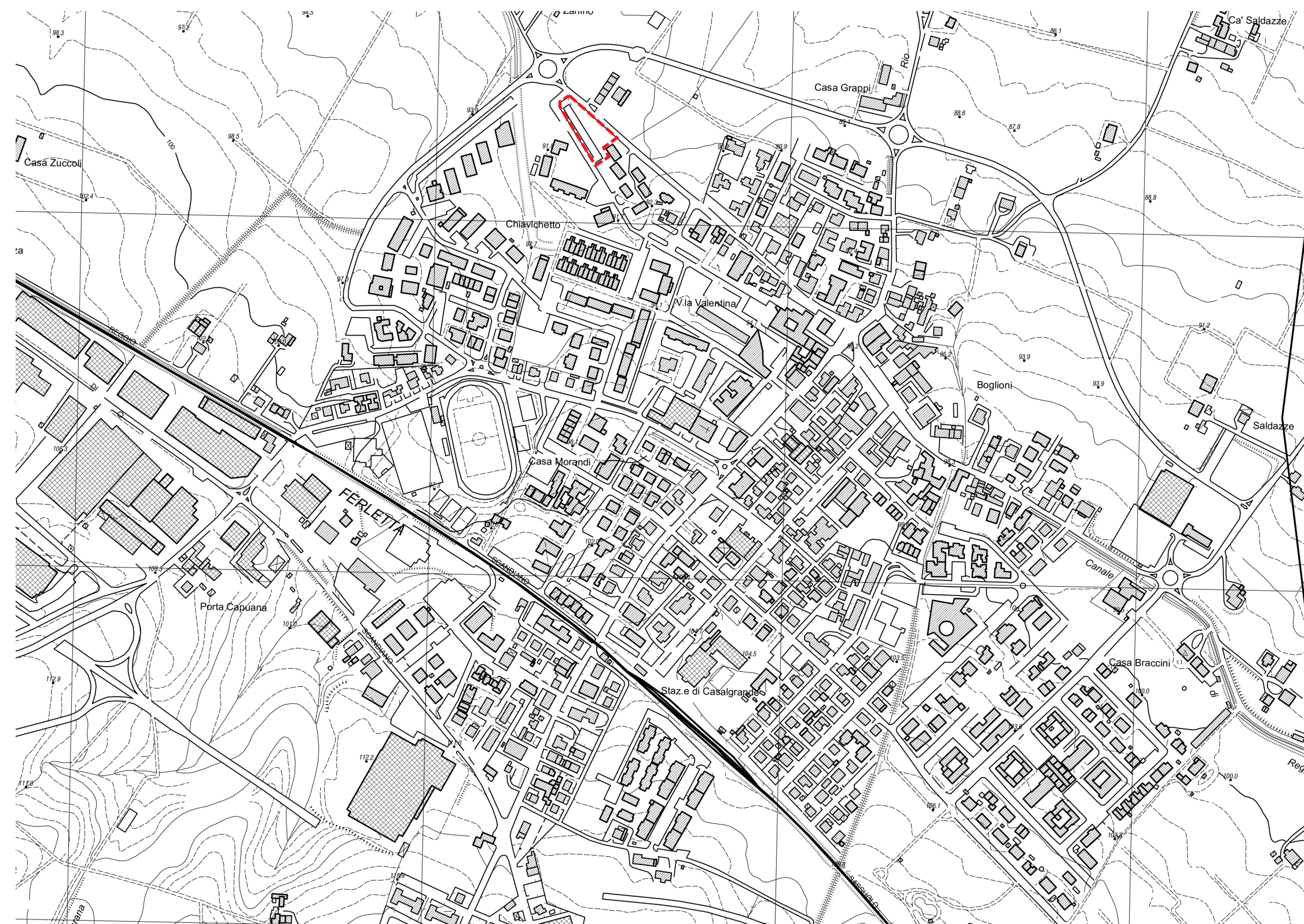
Estratto di Mappa Catastale N.C.E.U. di Reggio Emilia, Censuario di Casalgrande Foglio 12, Mappale 871 (parte)