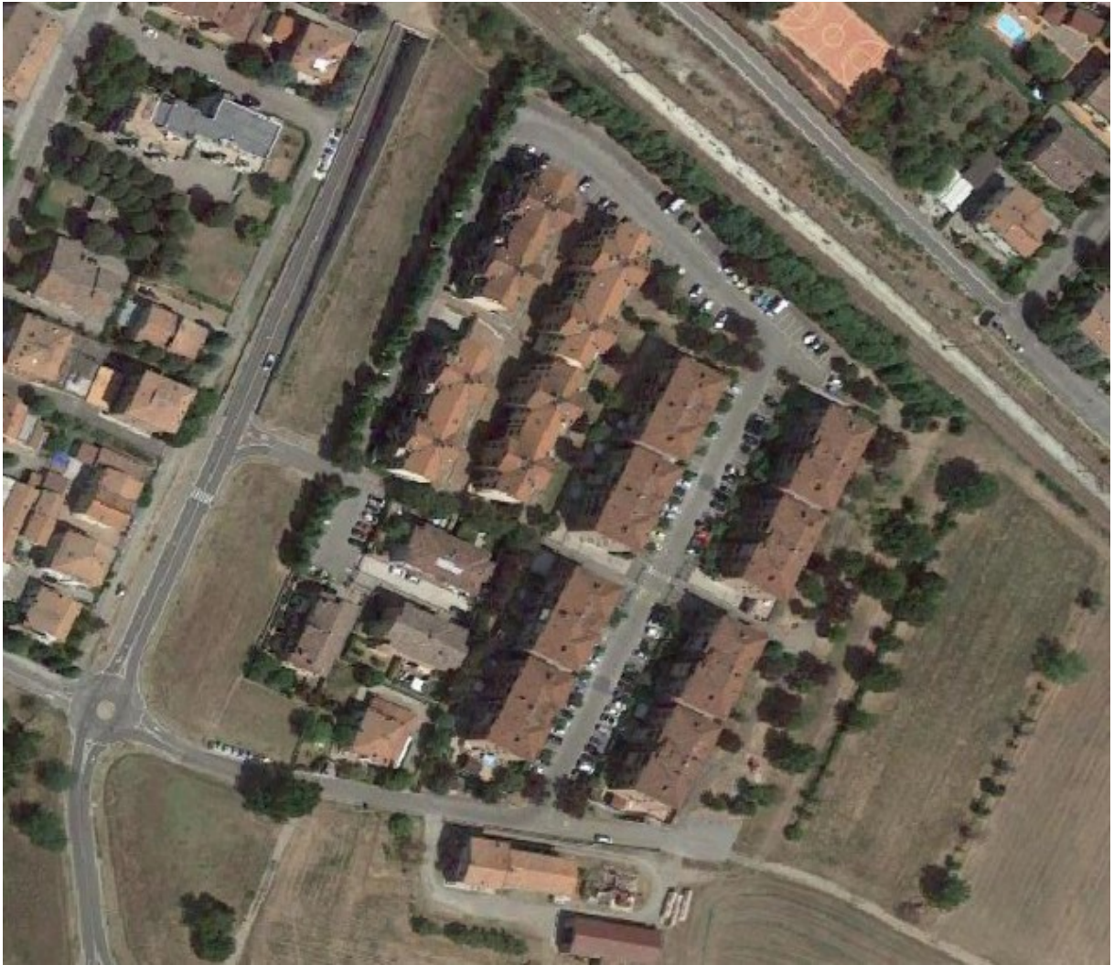
Immagine n. 1 – Localizzazione intervento

L'Amministrazione Comunale intende riqualificare il quartiere di Via Braille. Il quartiere è nato dalle urbanizzazioni degli anni 2000, si trova a sud del centro di Casalgrande Capoluogo tra il limite della ferrovia RE- Sassuolo e la Strada Provinciale SP 41.